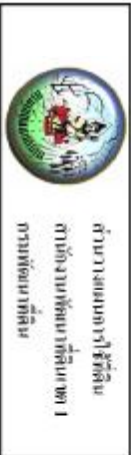
รูปที่ 23 แผนที่แสดงการใช้ที่ดิน ตำบลพระ อำเภอเมืองนครนายก จังหวัดนครนายก